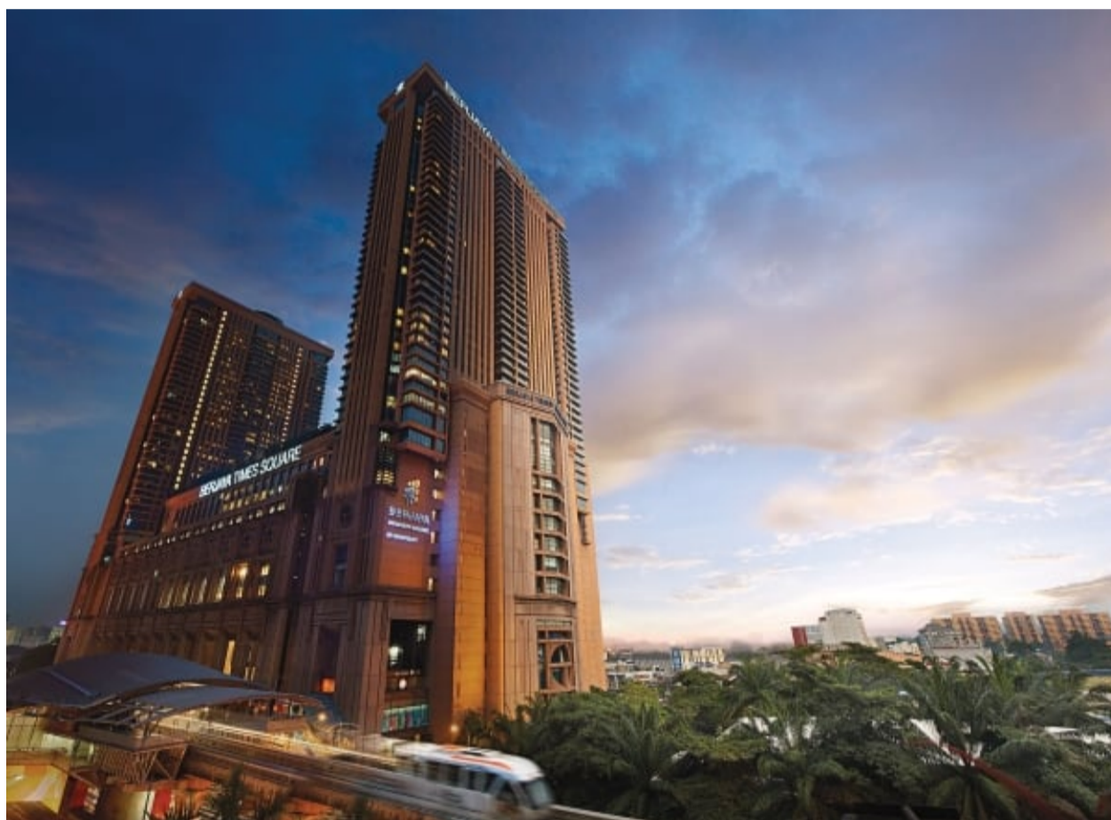
成功大学学院是大马首屈一指的礼待、旅游、厨艺、活动、零售与商业管理教育机构，强调体验式学习，让学生具备理论知识和实践技巧。

把“成功融入”视作教学理念的成功大学学院（BERJAYA University College）与国际知名高等学府和专业机构合作提供海外留学渠道，培养出具备国际思维的优秀学子。